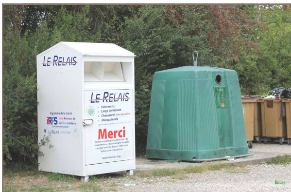
Les Tougétois ont donné 425 kgs de vêtements dans ce conteneur au mois de juillet.

Si le conteneur est plein, ne pas déposer les sacs par terre car ils risquent d'être volés ou abîmés. Appeler au numéro indiqué sur la borne. Pas de recyclage matière possible pour les K-way, les cirés, les chaussures, la petite maroquinerie et les jouets : ils doivent donc être en bon état ou facilement réparables pour être redistribués.