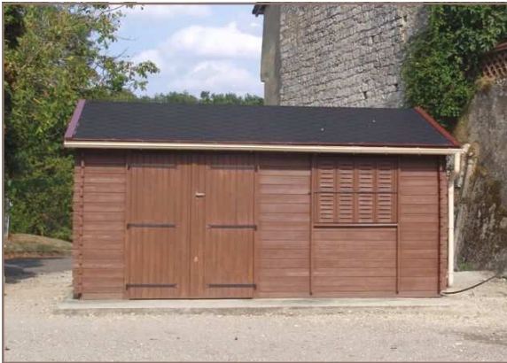
Local de la pétanque

Divers travaux de rénovation ont été effectués dans les logements communaux : peinture, papiers peints, isolation, revêtements seront terminés à la fin du mois dans l'appartement de la Poste. Le logement du foyer sera également rafraîchi ce mois.