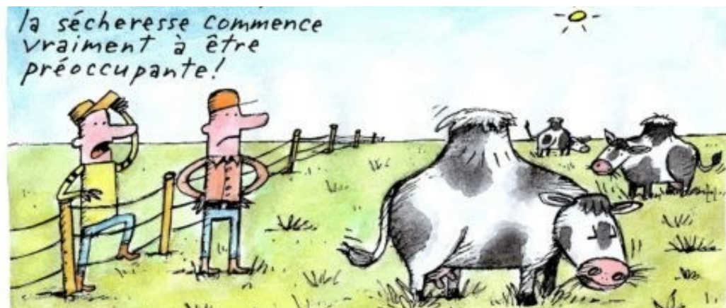
Bulletin municipal n°67 - Mai 2023